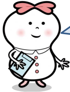
★府立 かんごちゃん★ (看護部キャラクター)

皆さんから看護部LINEに頂いた採用に関するご質問にお答えしています！ ご質問やご意見は右のQRコードを読み取って看護部公式アカウントをお友達追加後にLINEでメッセージを送って下さい！